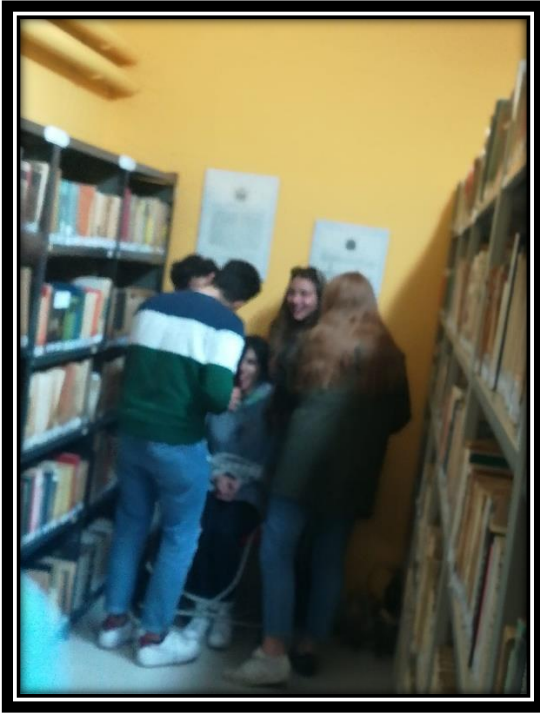
LA TROUPE AU TRAVAIL